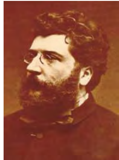
Bizet en 1875.