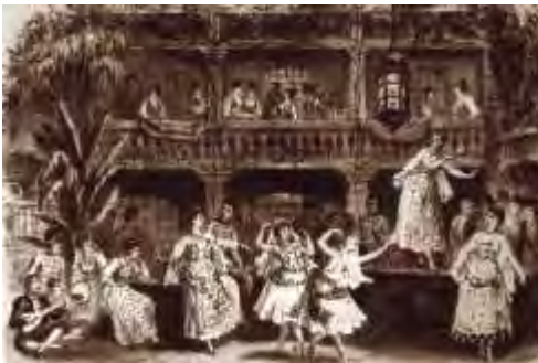
Décor à la création.

Don José réalise qu'il est maintenant devenu complice et qu'il est dans l'obligation de se joindre à Carmen et ses amis. Tous chantent le bonheur du contrebandier : la liberté.