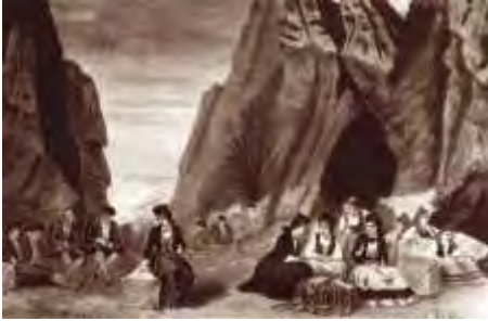
Décor à la création à l'Opéra Comique

Les bohémiens contrebandiers sont en train d'installer leur campement. Don José exprime son angoisse à l'idée de devenir déserteur et de surcroît contrebandier, mais il aime Carmen. Carmen de son côté laisse entendre qu'elle commence à se lasser de Don José.