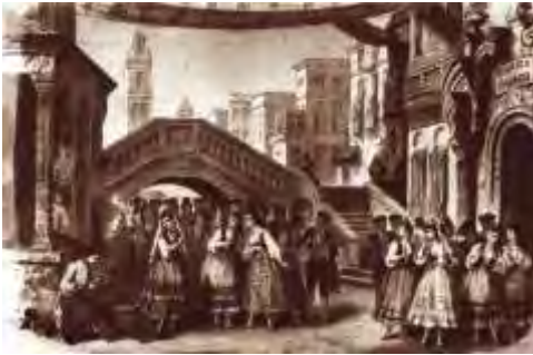
Décor à la création.

Sur une place de Séville : une manufacture de tabac et un poste de garde.