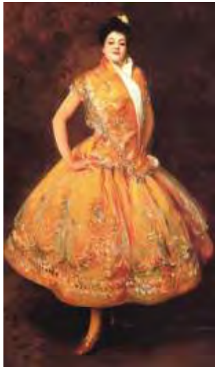
Carmencita par John Singer Sargent (Musée d'Orsay).