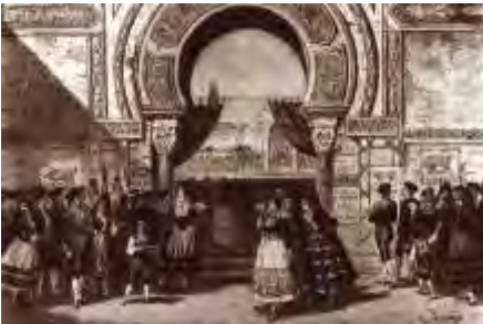
Décor à la création en 1875

La place publique de Séville, à l'extérieur des Arènes.